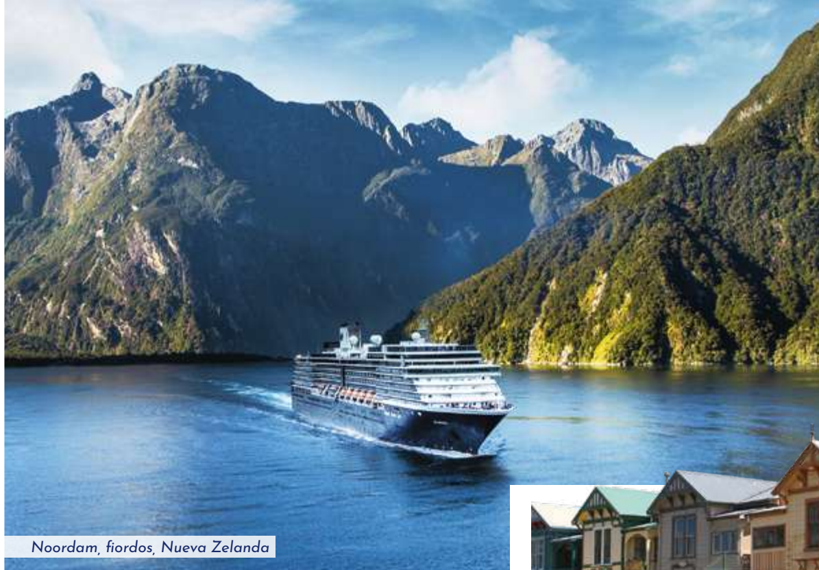
Noordam, fiordos, Nueva Zelanda