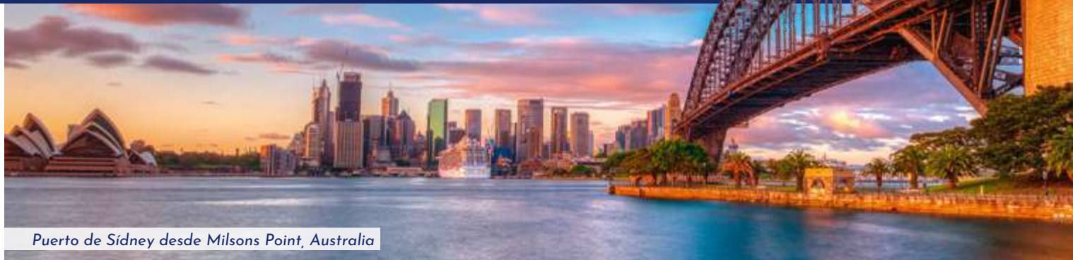
Puerto de Sidney desde Milsons Point, Australia