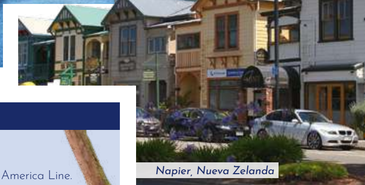
Napier, Nueva Zelanda